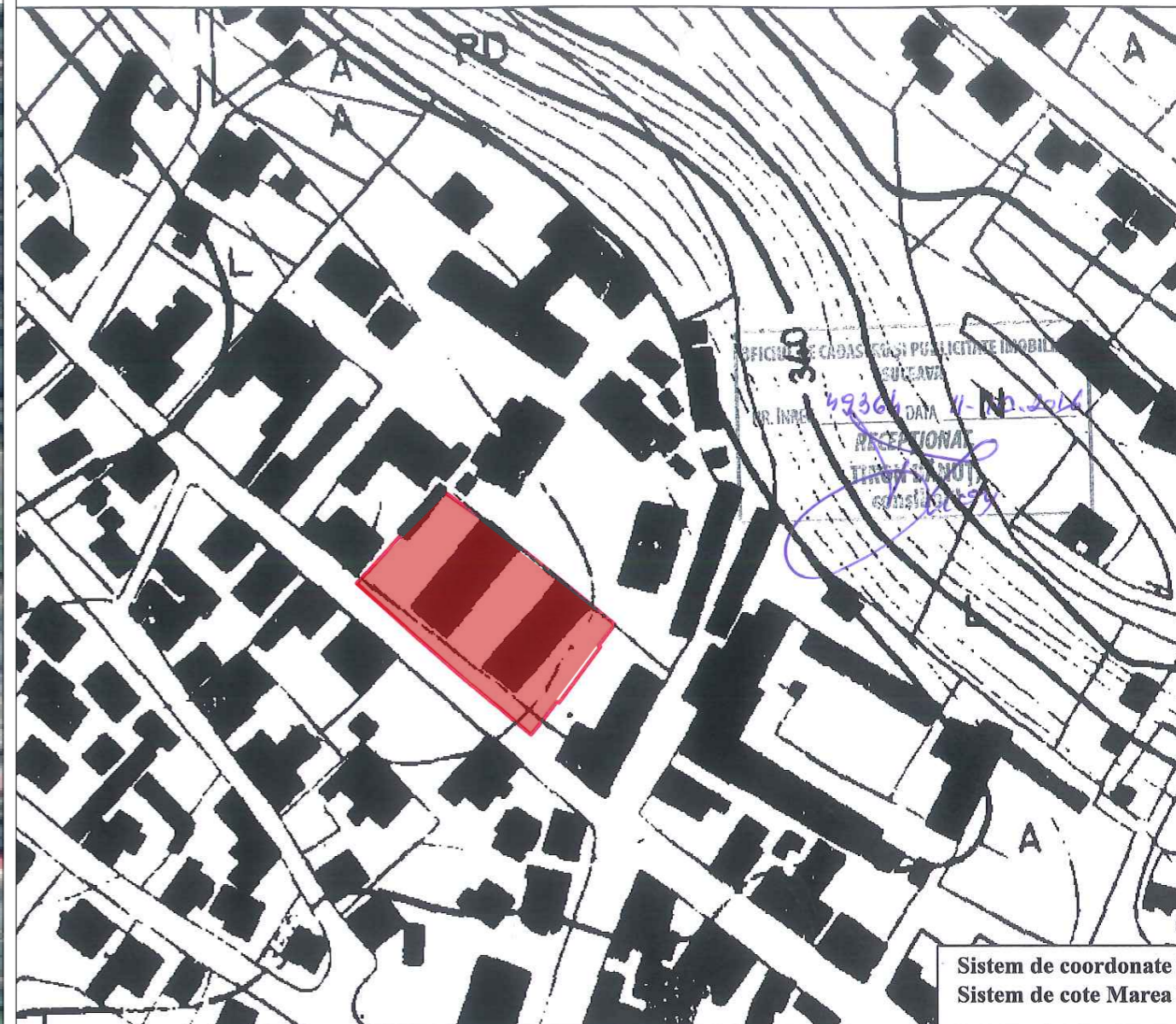
Sistem de coordonate Sistem de cote Marea